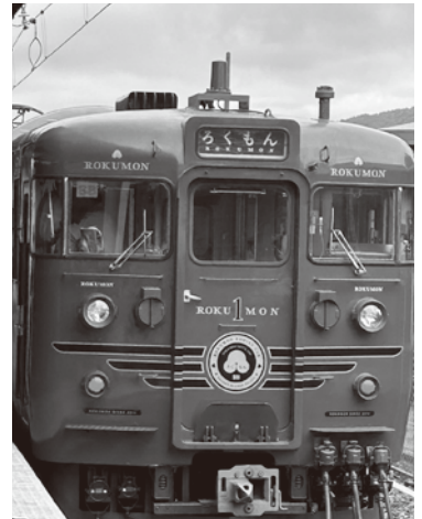
しなの鉄道ろくもん