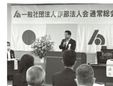
総会会長あいさつ